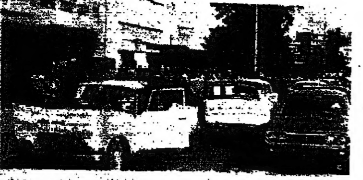
نظارة السيارات لزراعي التبغ الشمال عند وصولها الى سراي طرابلس